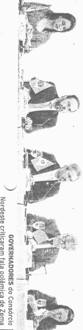
GOVERNADORES do Consórcio Nordeste criticaram fala polémica de Zema