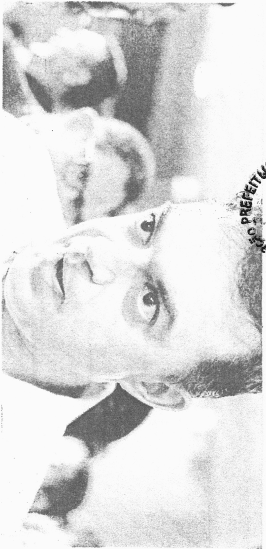
FERNANDO Santana tem base eleitoral em Juazeiro do Norte e é cotado para ser candidato a prefeito

O deputado estadual Fernando Santana (PT) reforçou haver distanciamento entre ele e o atual prefeito de Juazeiro do Norte, Glédson Bezerra (Podemos). Santana destacou que sempre teve uma relação "positiva" com o gestor, mas apontou que o prefeito vem fazendo política de "forma isolada" e que a vontade de apoiá-lo à reeleição "vem diminuindo".