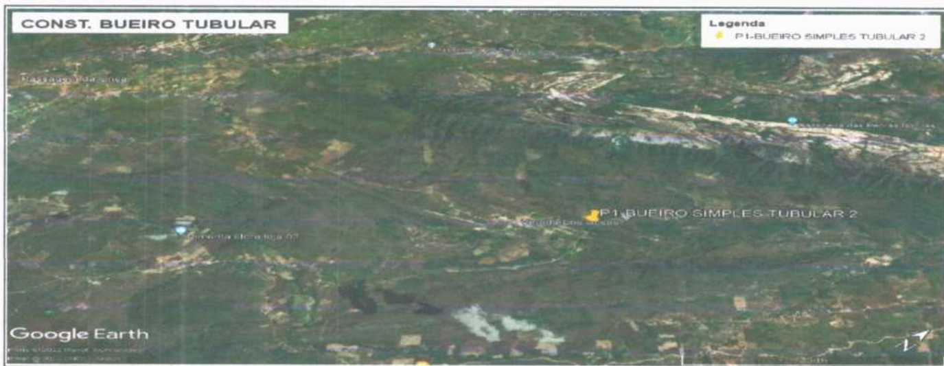
FOTO 7 - IMAGEM SATÉLITE BCH