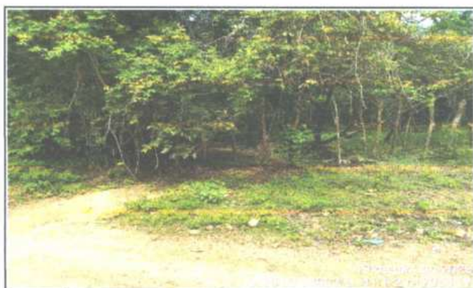
FOTO 2 - À JUSANTE - BUEIRO SIMPLES TUBULAR