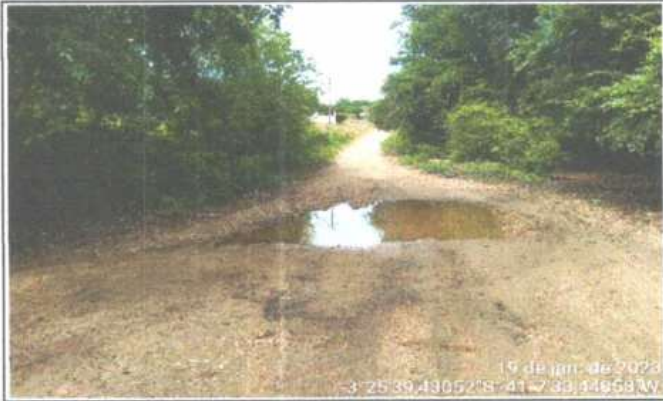
FOTO 7 - LOCAL DA CONSTRUÇÃO - BUEIRO RETANGULAR

Obra: CONSTRUÇÃO DO BUEIRO QUINTUPLO RETANGULAR DA LOCALIDADE ST. SARAIVA- COORD. UTM: 263804.00 m E / 9620870.00 m S. Local: Distrito de Passagem da Onça - Município de Viçosa do Ceará - CE