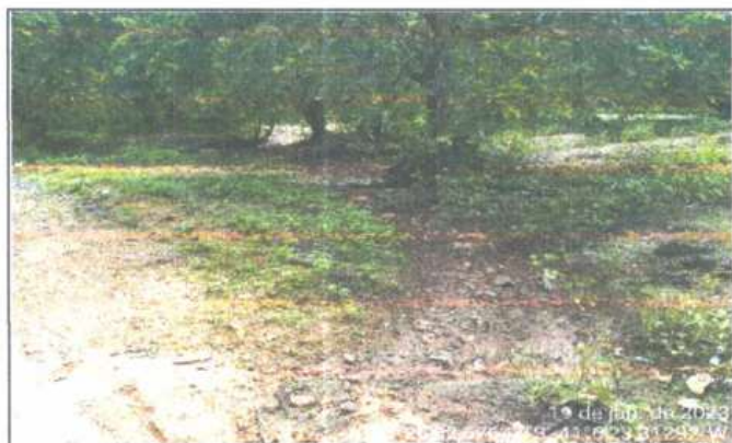
FOTO 3 - À MONTANTE - BUEIRO SIMPLES TUBULAR