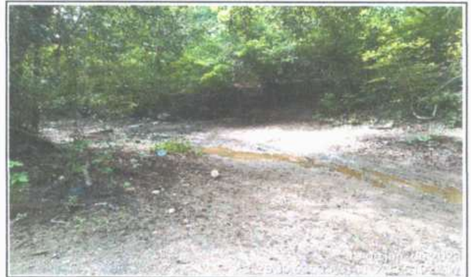
FOTO 2 - À JUSANTE - BUEIRO RETANGULAR