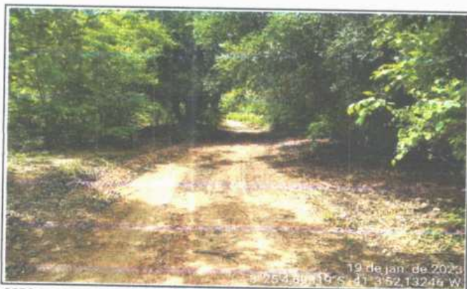
FOTO 1 - LOCAL DA CONSTRUÇÃO - BUEIRO SIMPLES TUBULAR