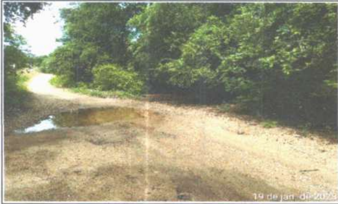
FOTO 1 - LOCAL DA CONSTRUÇÃO - BUEIRO RETANGULAR

Obra: CONSTRUÇÃO DO BUEIRO QUINTUPLO RETANGULAR DA LOCALIDADE ST. SARAIVA- COORD. UTM: 263804.00 m E / 9620870.00 m S. Local: Distrito de Passagem da Onça - Município de Viçosa do Ceará - CE