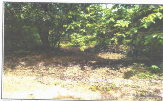
FOTO 2 - À JUSANTE - BUEIRO SIMPLES TUBULAR