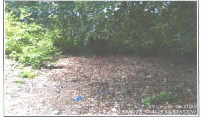
FOTO 8 - À MONTANTE - BUEIRO