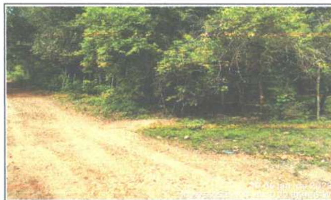
FOTO 6 - LOCAL DA CONSTRUÇÃO - BUEIRO SIMPLES TUBULAR