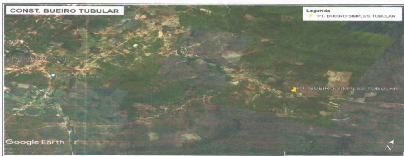
FOTO 7 - IMAGEM SATÉLITE BCH