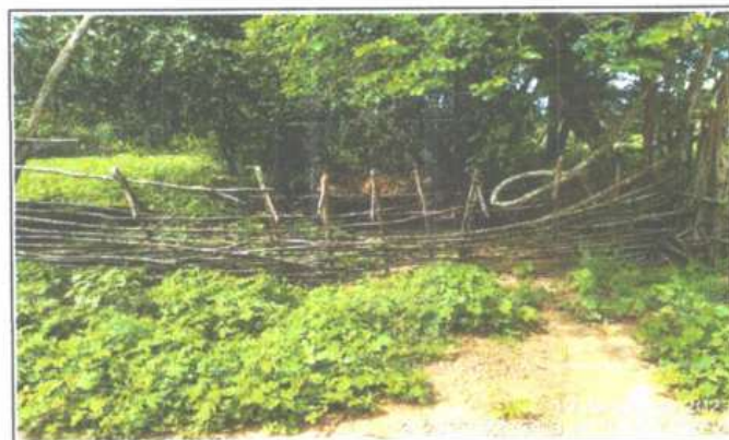
FOTO 3 - À MONTANTE - BUEIRO