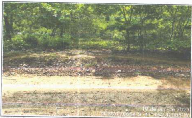
FOTO 3 - À MONTANTE - BUEIRO SIMPLES TUBULAR