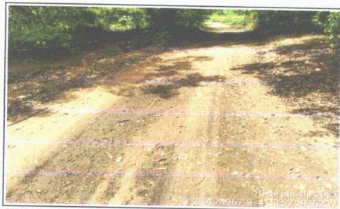
FOTO 6 - LOCAL DA CONSTRUÇÃO - BUEIRO SIMPLES TUBULAR