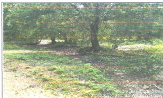
FOTO 4 - À MONTANTE - BUEIRO SIMPLES TUBULAR