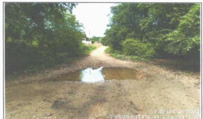
FOTO 6 - LOCAL DA CONSTRUÇÃO - BUEIRO RETANGULAR