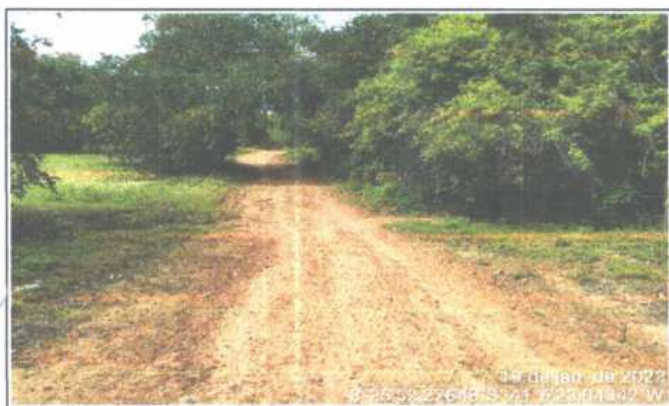
FOTO 1 - LOCAL DA CONSTRUÇÃO - BUEIRO SIMPLES TUBULAR