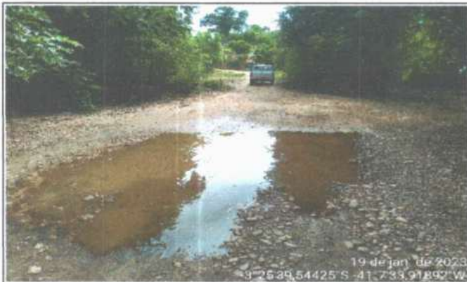
FOTO 3 - LOCAL DA CONSTRUÇÃO - BUEIRO RETANGULAR