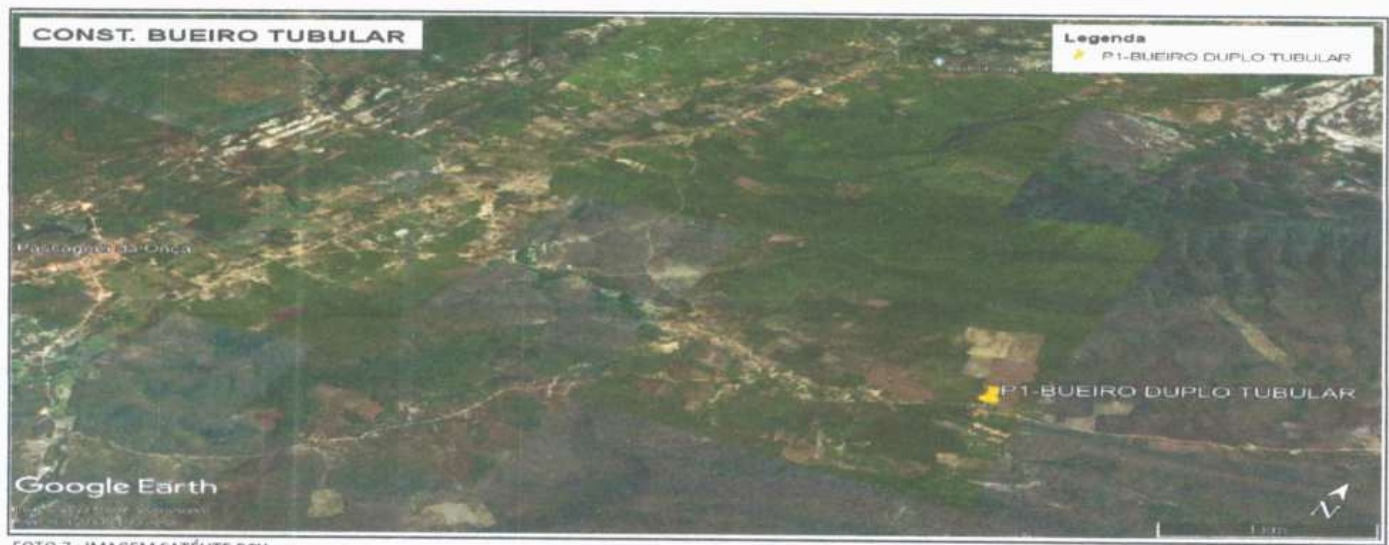
FOTO 7 - IMAGEM SATÉLITE BCH