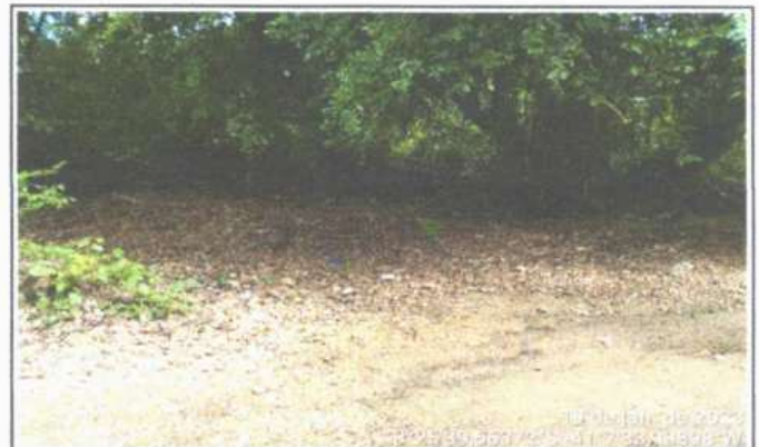
FOTO 4 - À MONTANTE - BUEIRO RETANGULAR