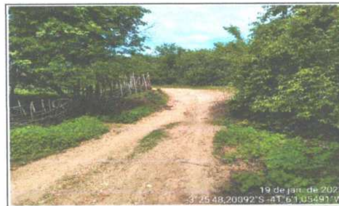
FOTO 6 - LOCAL DA CONSTRUÇÃO-BUEIRO