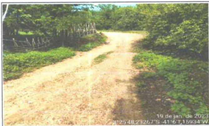
FOTO 1 - LOCAL DA CONSTRUÇÃO - BUEIRO