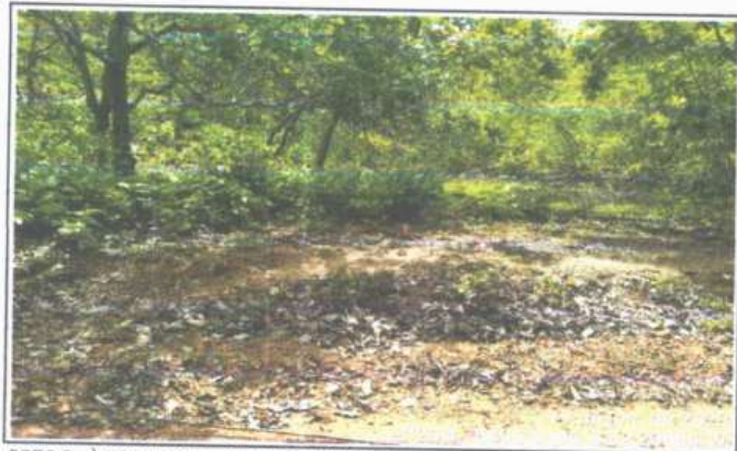
FOTO 5 - À MONTANTE - BUEIRO SIMPLES TUBULAR