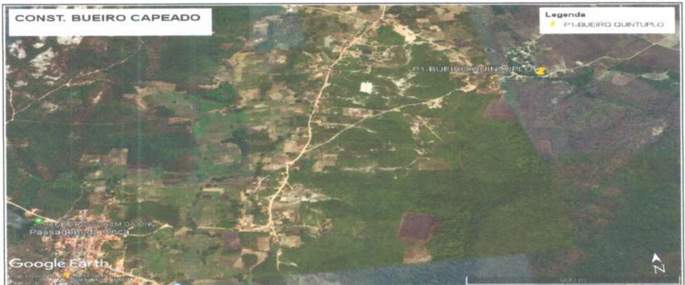
FOTO 9 - IMAGEM SATÉLITE BCH