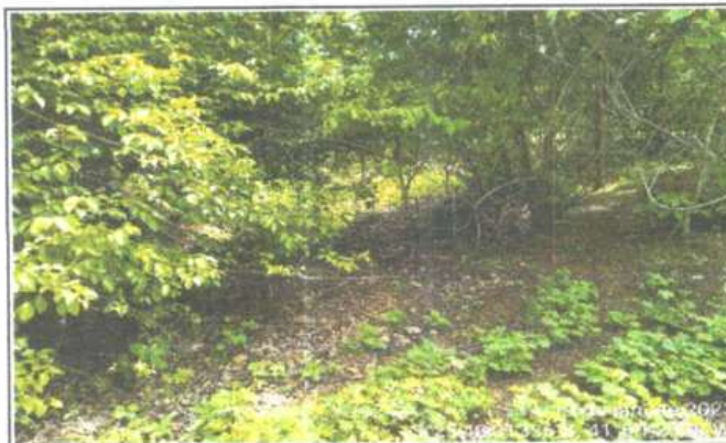
FOTO 5 - À JUSANTE - BUEIRO