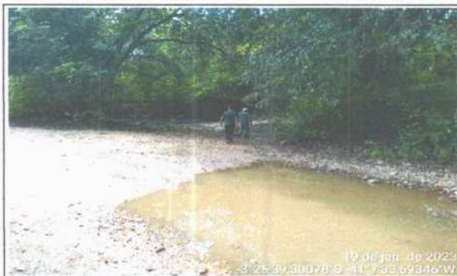
FOTO 5 - À JUSANTE - BUEIRO