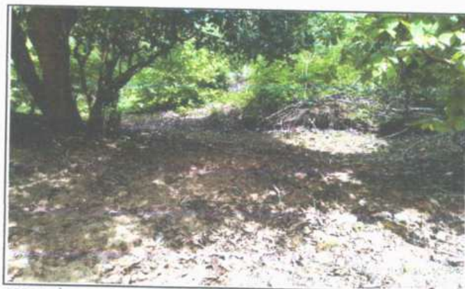
FOTO 4 - À JUSANTE - BUEIRO SIMPLES TUBULAR