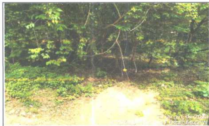
FOTO 5 - À JUSANTE - BUEIRO SIMPLES TUBULAR