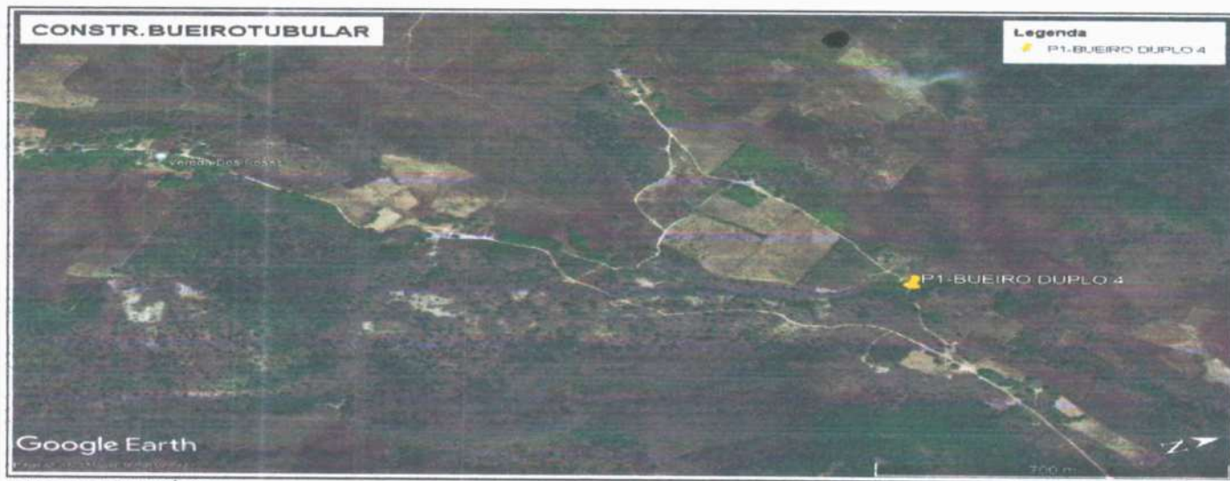
FOTO 7 - IMAGEM SATÉLITE BCH