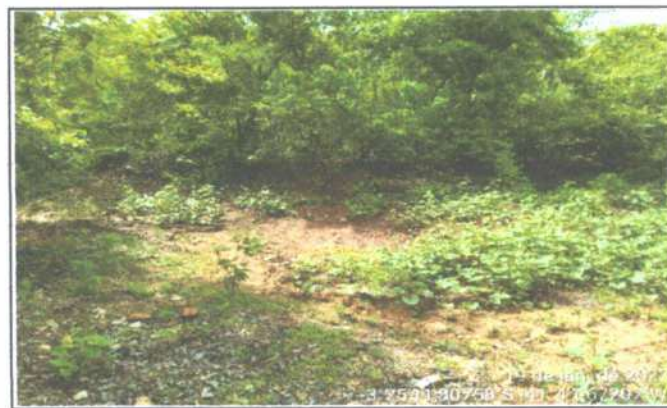
FOTO 2 - À JUSANTE - BUEIRO