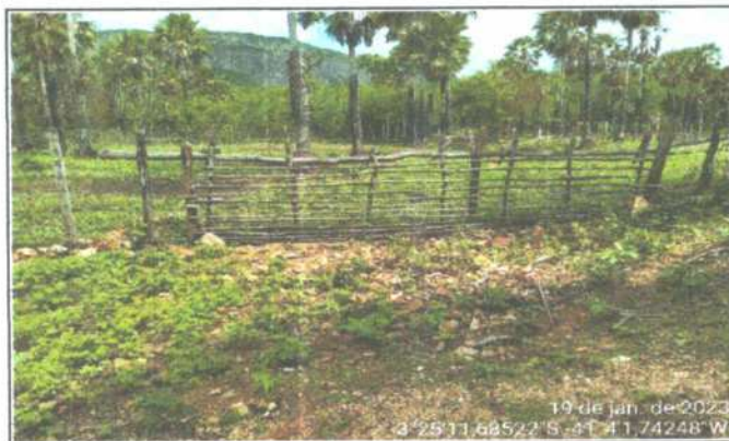
FOTO 3 - À MONTANTE - BUEIRO