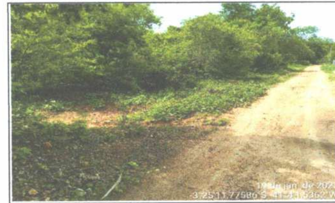
FOTO 6 - LOCAL DA CONSTRUÇÃO-BUEIRO