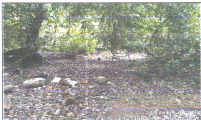
FOTO 3 - À JUSANTE - BUEIRO