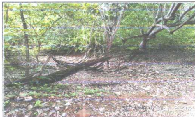
FOTO 5 - À MONTANTE - BUEIRO