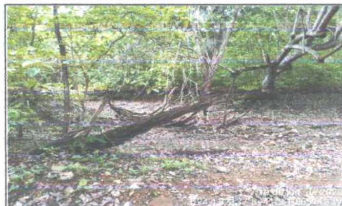
FOTO 4 - À MONTANTE - BUEIRO