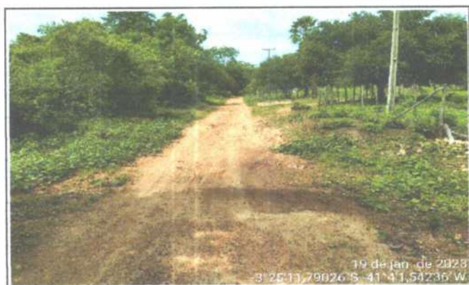
FOTO 1 - LOCAL DA CONSTRUÇÃO - BUEIRO