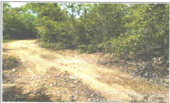
FOTO 3 - À JUSANTE - BUEIRO SIMPLES TUBULAR