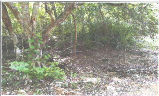
FOTO 5 - À MONTANTE - BUEIRO SIMPLES TUBULAR