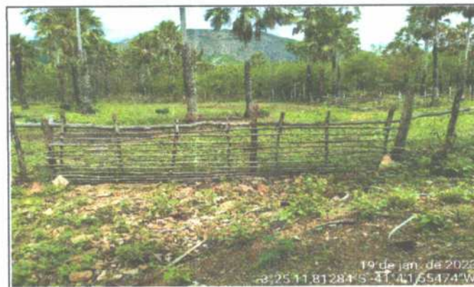
FOTO 5 - À JUSANTE - BUEIRO