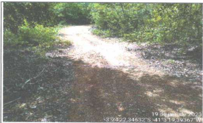
FOTO 6 - LOCAL DA CONSTRUÇÃO - BUEIRO SIMPLES TUBULAR