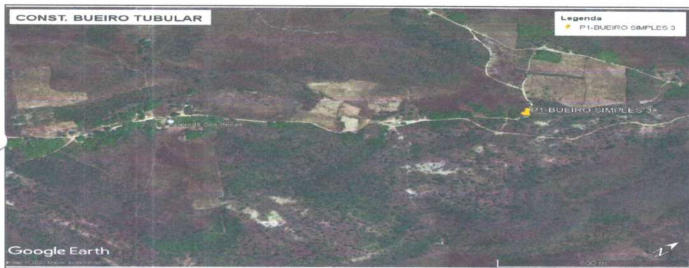
FOTO 7 - IMAGEM SATÉLITE BCH