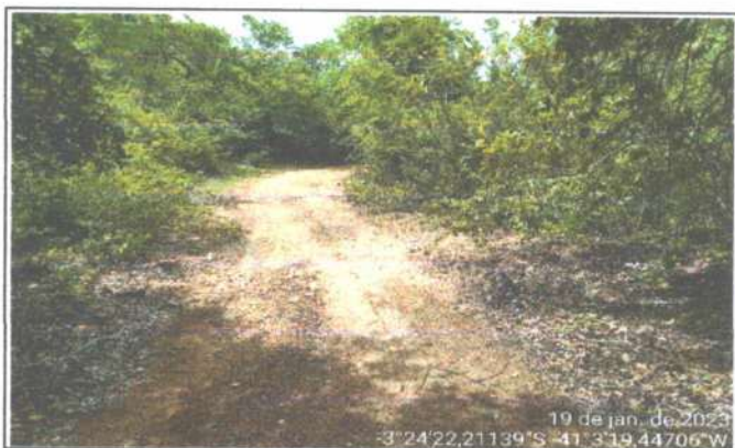
FOTO 4 - LOCAL DA CONSTRUÇÃO - BUEIRO SIMPLES TUBULAR