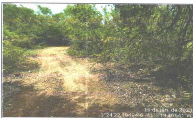
FOTO 1 - LOCAL DA CONSTRUÇÃO - BUEIRO SIMPLES TUBULAR