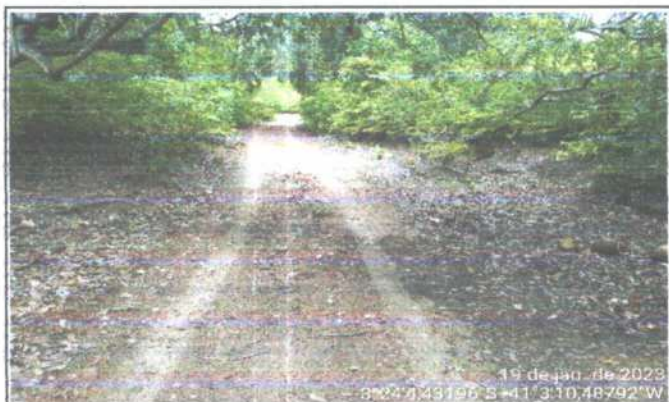
FOTO 1 - LOCAL DA CONSTRUÇÃO - BUEIRO