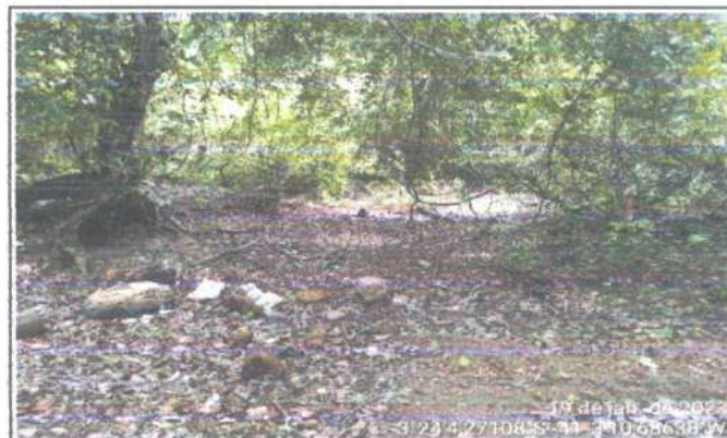
FOTO 2 - À JUSANTE - BUEIRO