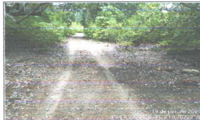
FOTO 6 - LOCAL DA CONSTRUÇÃO-BUEIRO