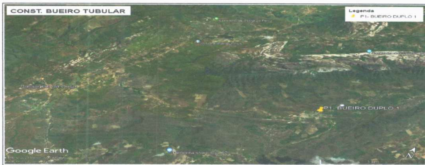
FOTO 7 - IMAGEM SATÉLITE BCH