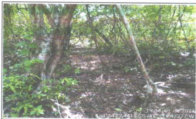
FOTO 2 - À MONTANTE - BUEIRO SIMPLES TUBULAR