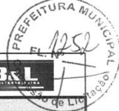
TABELA DE ENCARGOS SOCIAIS SINAPI 07/2017 COM DESONERAÇÃO